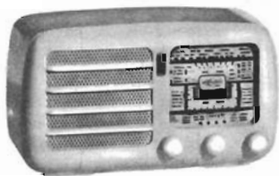
L. 33.900 mobile in materiale plastico