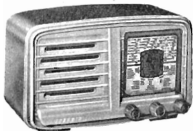
L. 15.950 mobile in materiale plastico