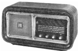
L. 58.000 mobile in legno

Gamme d'onda: medie - corte - MF. Preso d'antenna MA. MF presa a 75 - 300 ohm e incorporata. Valvole: n. 6 - tipi: americani. Raddrizzatore a secco. Indicatore di sintonia. Regolatore di tono per gli acuti e per i bassi. Potenza d'uscita: watt 5. Altoparlante: magnetodinamico diametro 250 mm. Commutatore di gamma a rotazione. Preso fonografica. Alimentazione: c a universale - W 60. Dimensioni: cm 62 x 32 x 39. Peso: kg 12.800.